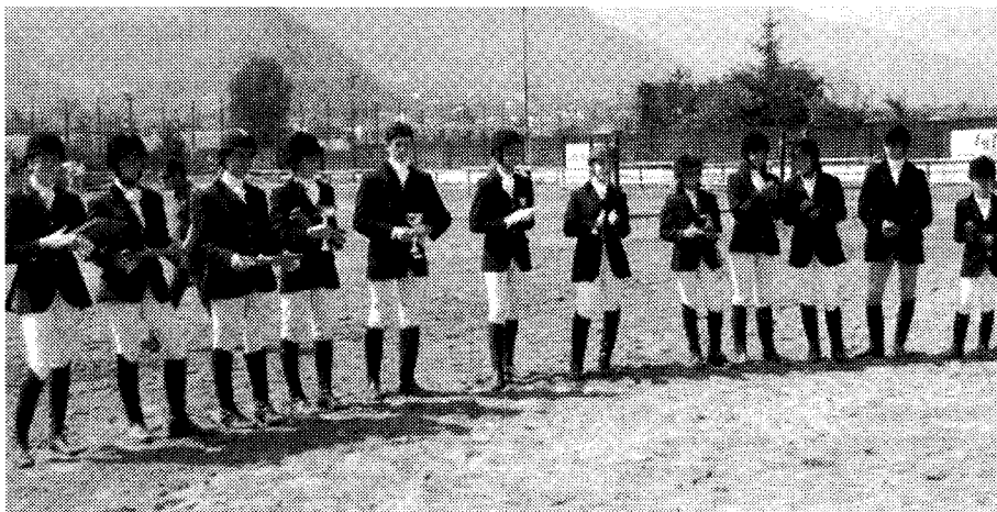
Gli atleti protagonisti della competizione di Dressage tenutasi a Tzambarlet di Aosta