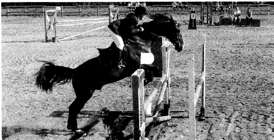
Eleganza e destrezza la prova del salto ostacoli è un connubio di grande effetto