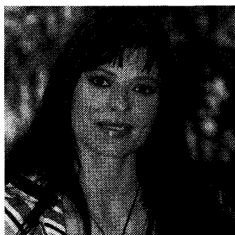
La show-girl Natalia Estrada