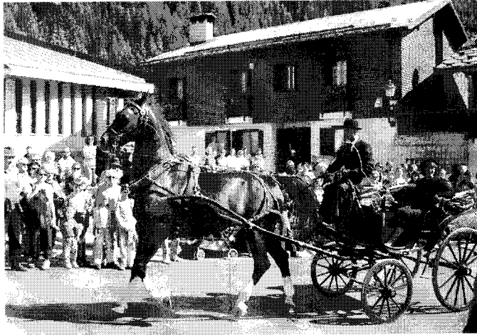
Un'immagine della scorsa edizione della sfilata

C HAMPOLUC - A chi ricorda Cenerentola, a chi ricorda tempi lontani, la carrozza rappresenta uno dei mezzi di trasporto più affascinanti e "maestosi". Un tempo indispensabile mezzo di trasporto, oggi viene utilizzata per eventi folkloristici, manifestazioni, rievocazioni storiche e matrimoni, impieghi "profani" che forse "sacrificano" un pò quella che la storia dell'antico mezzo. Ai piedi del Monte Rosa, si è svolta la ormai annuale sfilata di carrozze. E chissà se hanno creduto di trovarsi davvero in mezzo ad un favola i bambini di Champoluc, che hanno visto "circolare" il mezzo per le vie del loro paese. Come si guida una