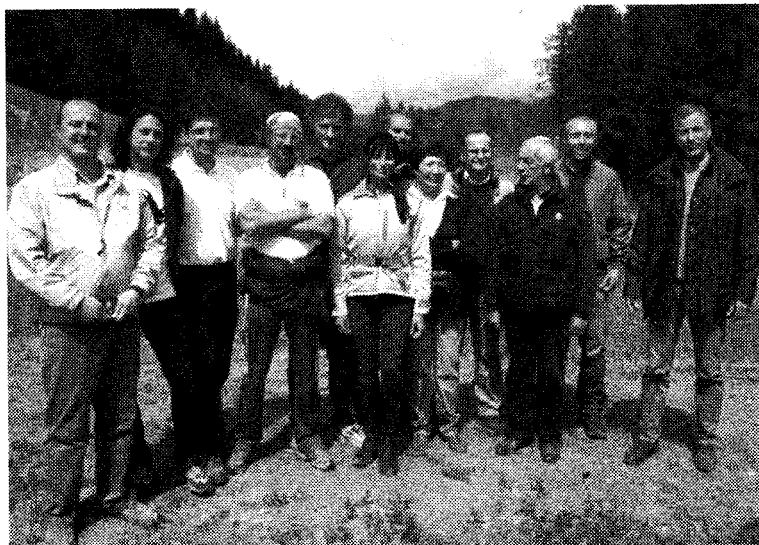
Natalia Estrada, al centro, con i membri dell'organizzazione

Alla competizione, come dicevamo, ha partecipato anche la popolare showgirl spagnola che, per la sua bellezza e notorietà, ha rubato la scena agli altri protagonisti. L'affermata ballerina era iscritta nella categoria debuttanti, dove ha conquistato il successo finale in sella a Douarec, cavallo vincitore della Word Cup '05.